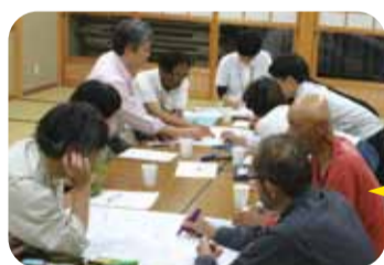
和田5区・6区合同で行われた座談会。熱心に情報交換が行われている様子。

今年度も各地区で、「ご近助見守りネットワーク」会議が開催されています。この「ご近助見守りネットワーク」地区座談会とは、地域の誰もが安心して暮らしていけるよう、区長や民生委員の方々をはじめ、地区で活動する様々な方が、その地域の情報や課題を確認し合い、見守り・支え合いの体制づくりをしていくものです。また、この座談会を通して、横の繋がりを作ることも意義の一つです。このように普段から話し合う場を設けることで、平時だけでなく、災害発生時のような緊急事態においても円滑な対応ができるようになることを期待しています。 同じ「高浜町」であっても、地域の状況は様々です。区長や自主防災組織の方が中心となり、区内で見守りの体制が整っている地区もあれば、少子高齢化等様々な要因で地域の現状が把握しづらくな